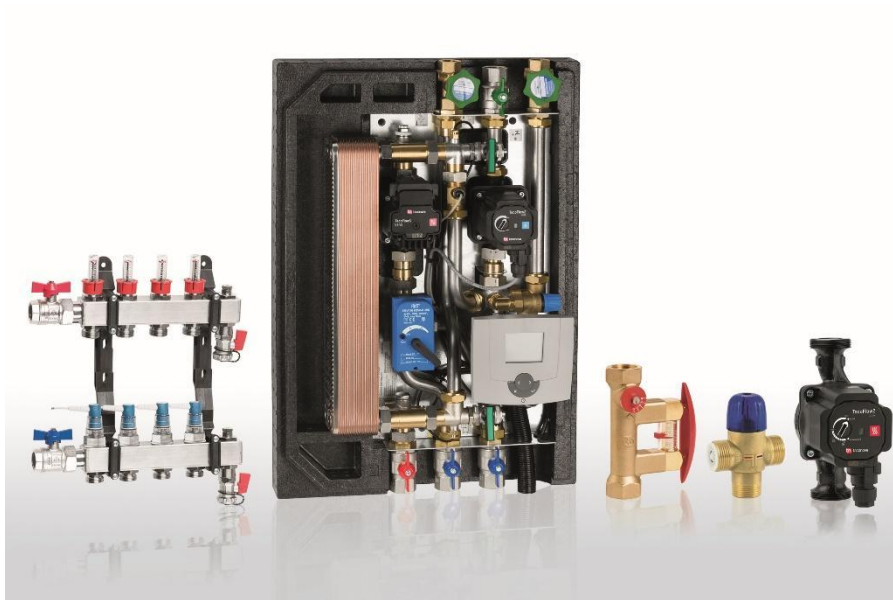
Immagine 4: L'ampio catalogo Taconova