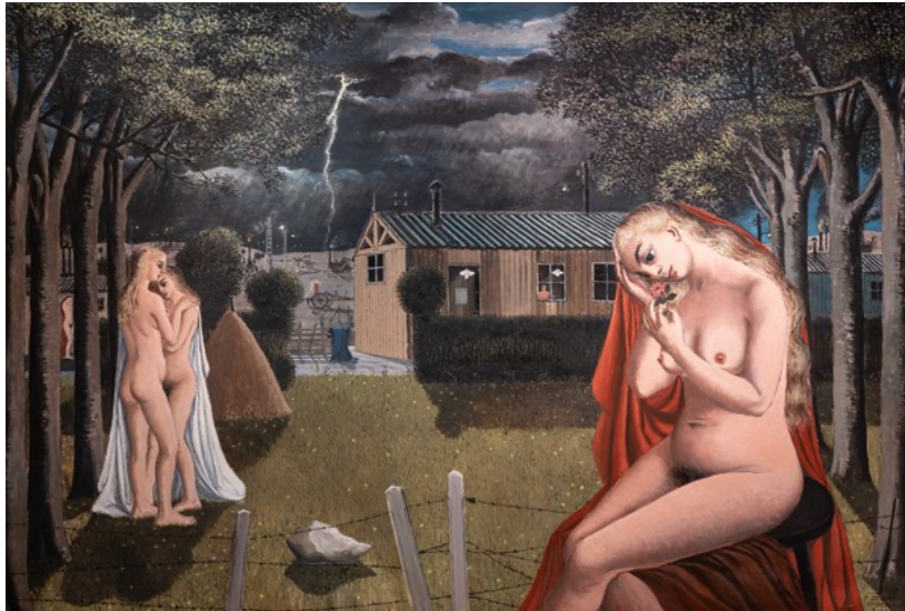
Paul Delvaux, The Storm , 1962